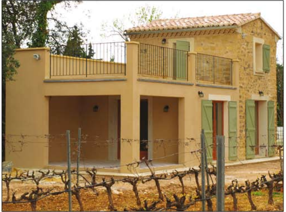
Le Mazet de Marotte

Op dit moment wordt ons zwembad opnieuw betegeld om klaar te zijn voor de eerste gasten. En de hele winter hebben we hard gewerkt aan het opknappen van onze nieuwe gîte 'Le Mazet de Marotte'. Wij wilden de gîte graag opknappen met authentieke materialen dus hebben wij druk gespeurd op de Franse versie van Marktplaats. We vonden er bijvoorbeeld meer dan 200 jaar oude plavuizen. De Mazet wordt dus steeds mooier maar het is nog even wachten op de stroomaansluiting voor we dit onderkomen echt kunnen gebruiken. Het is en blijft Frankrijk dus houden bij elke aanvraag voor verhuur een slag om de arm want eerst moet er stroom zijn! Wilt u ook een vakantie doorbrengen in één van onze gîtes, kijk dan op : www.marottevins.com voor meer informatie en laat ons uw belangstelling weten via : info@marottevins.com