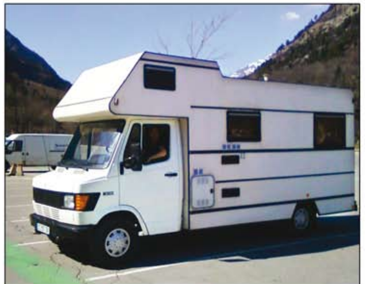
« Camper de Marotte »

Onlangs hebben wij een klassieke Mercedes camper van ruim 30 jaar oud gekocht. Deze is van alle gemakken voorzien en ideaal om in alle rust de Provence mee te verkennen. En dat is goed nieuws voor u want deze camper is te huur. Lijkt het u dus fantastisch om vanuit Domaine de Marotte op pad te gaan met een klassieke camper, neemt u dan even contact met ons op voor uitgebreide informatie!