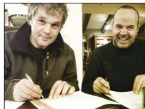
Het ondertekenen van het contract.